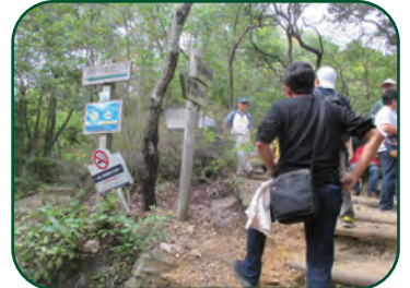
＜金華山の自然を学習します＞