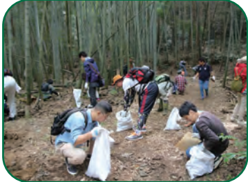
＜登山道整備/清掃活動を行います＞