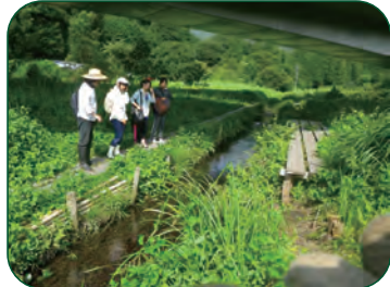
＜金華山の東側 達目洞の自然を満喫します＞