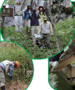
<大倉滝を見学します>