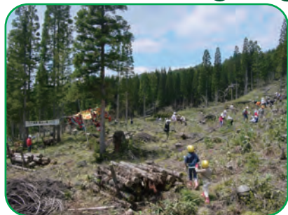
<広葉樹の森を育てましょう>