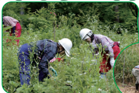
<植樹地の下草を刈ります>