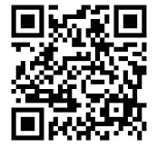
申込フォーム (Googleフォーム)

【ウェブサイト】 http://www.epo-chubu.jp ※参加申込フォームあり 【メール】 office@epo-chubu.jp