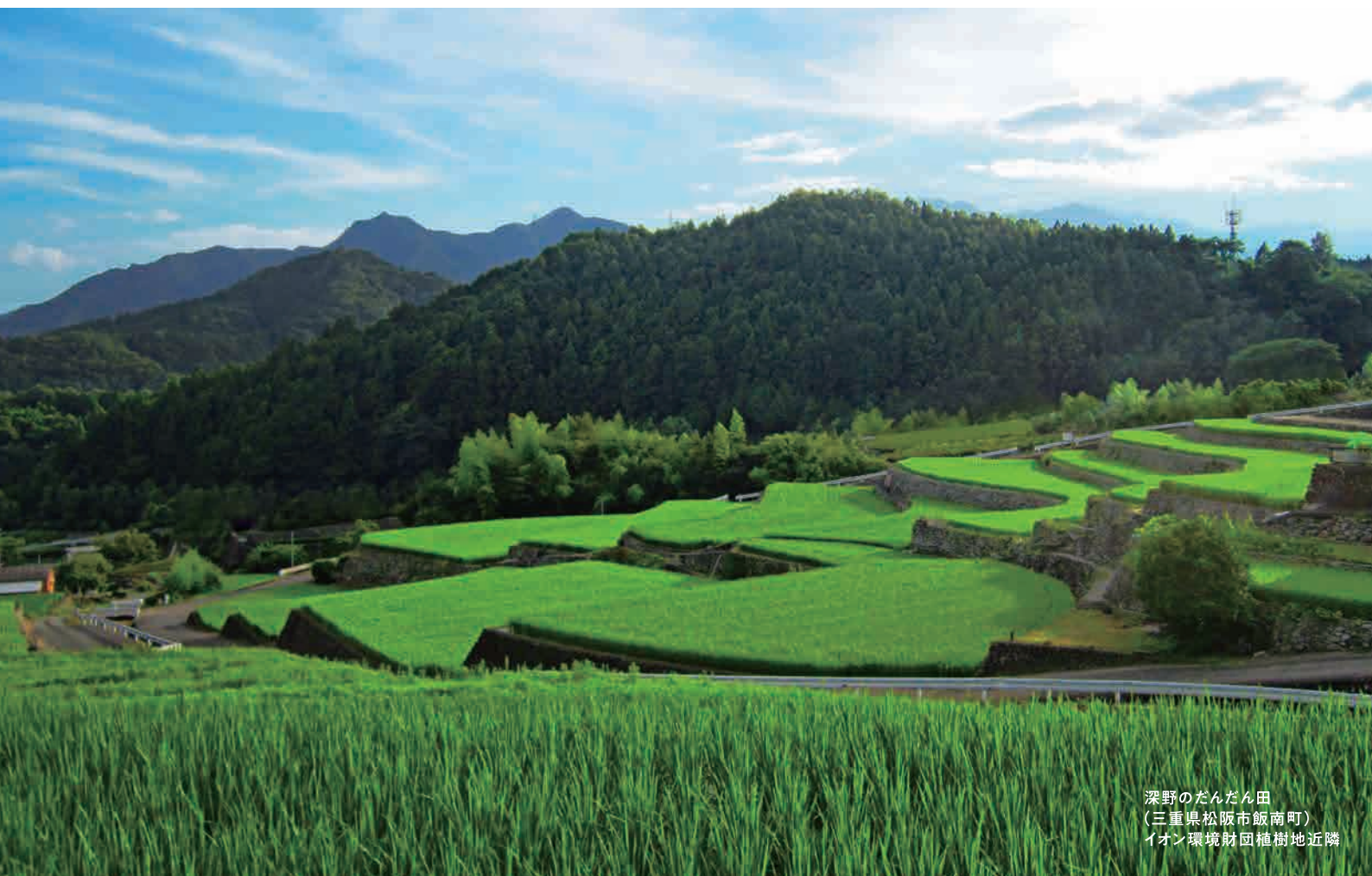
深野のたんたん田 (三重県松阪市飯南町) イオン環境財団植樹地近隣