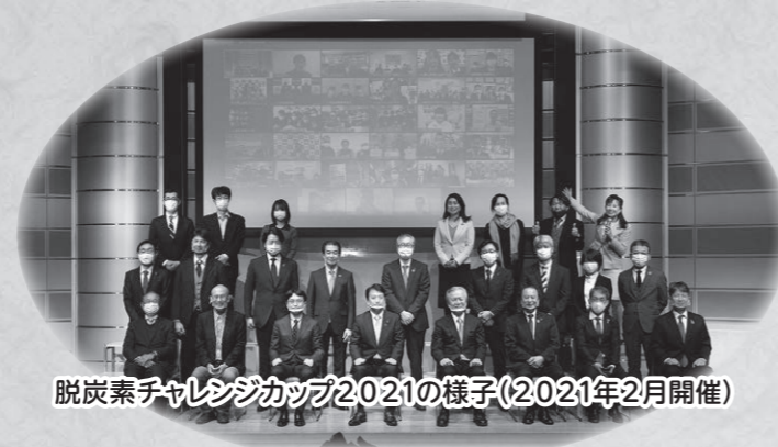
脱炭素チャレンジカップ2021の様子(2021年2月開催)

宮城県 宮城県農業高等学校 環境保全部 #ZEROマイプラ ~安全な食料生産と豊かな海作り~