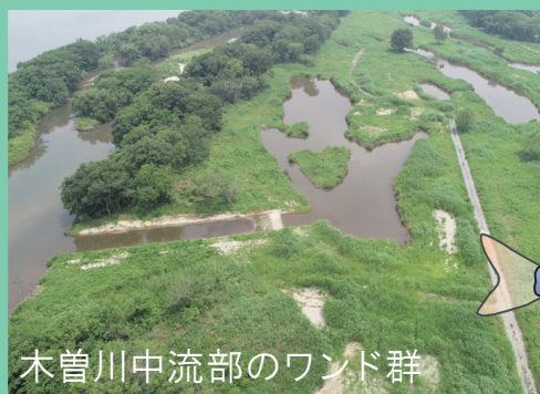
木曽川中流部のワンド群