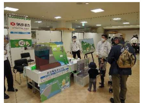
出展ブースのイメージ