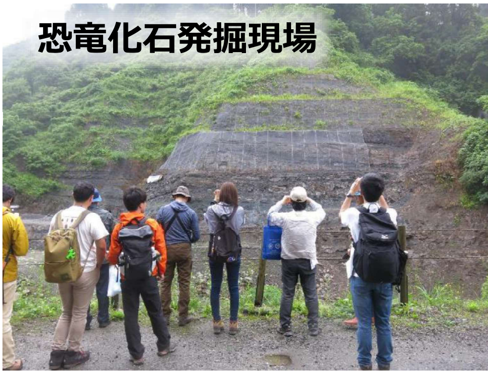
恐竜化石発掘現場