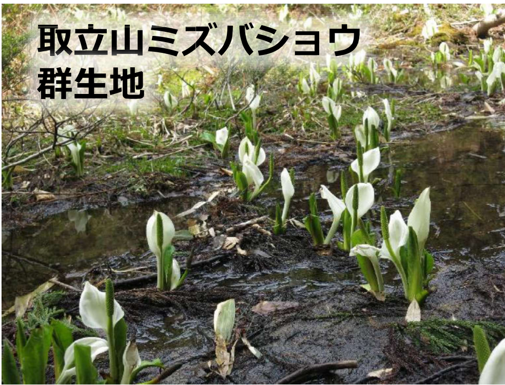
取立山ミズバショウ 群生地