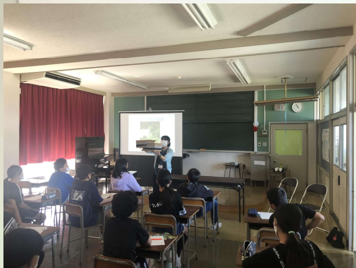
富山市 防災教育 呉羽断層を知り災害に強い地域づくりへ