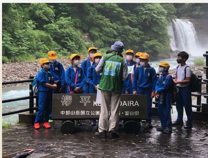
黒部市 黒部峡谷ジオパーク体験学習