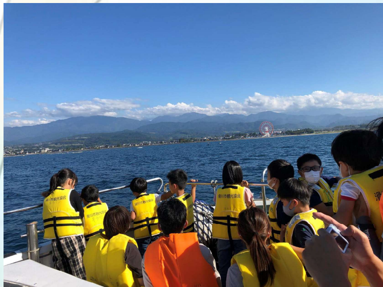
滑川市キラリン号体験 「富山湾から山を臨む」