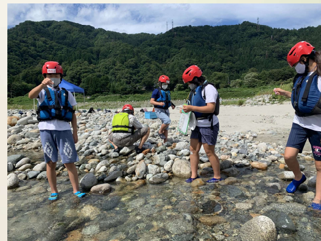
くろべ水の少年団 水生生物の観察