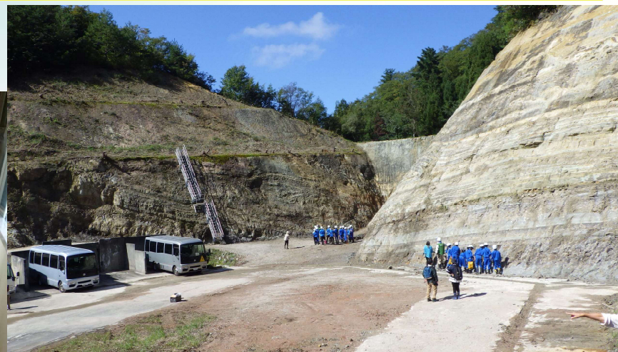
上市町ふるさと学習 化石の観察・露頭の観察