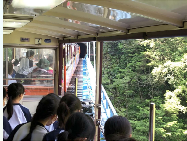
車窓から眺める深い谷