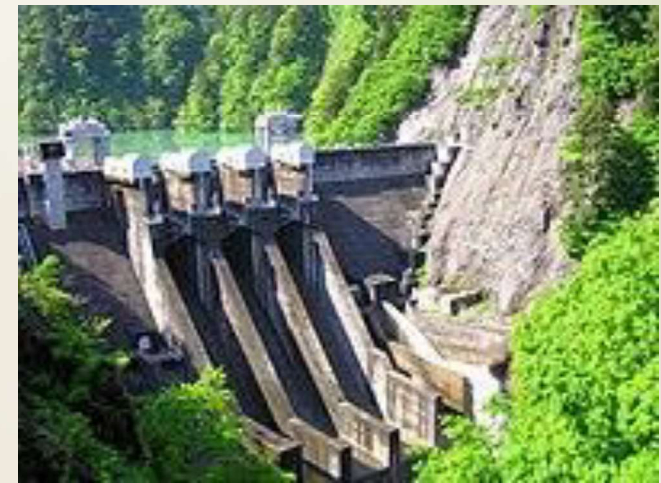
出し平ダムと宇奈月ダムの排砂 その良さと影響を考える