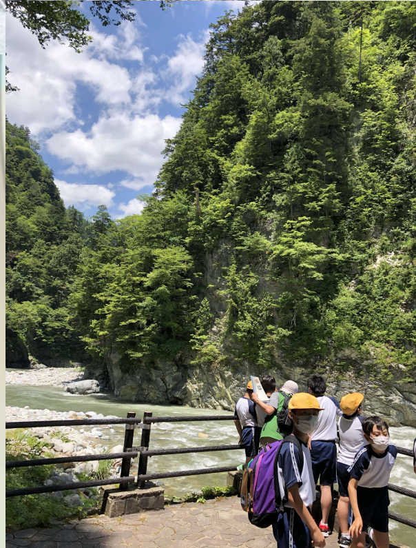
宇奈月駅からトロッコで 1時間20分 樺平