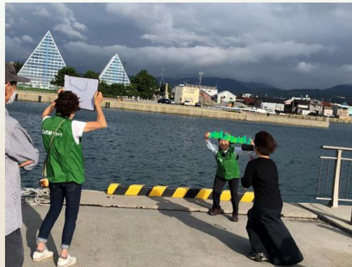
埋没林が発見された魚津港での撮影

埋没林博物館、ジオガイド、学芸員、撮影者、編集者、ジオパーク関係者等たくさんの方々の協力により完成 YouTubeにアップ