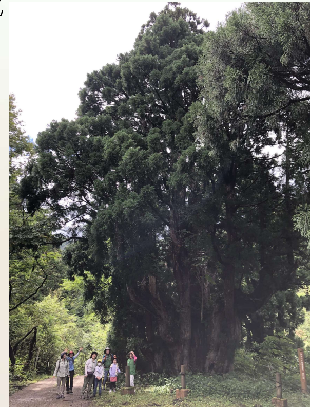
南又谷 洞杉での撮影 小学生も参加