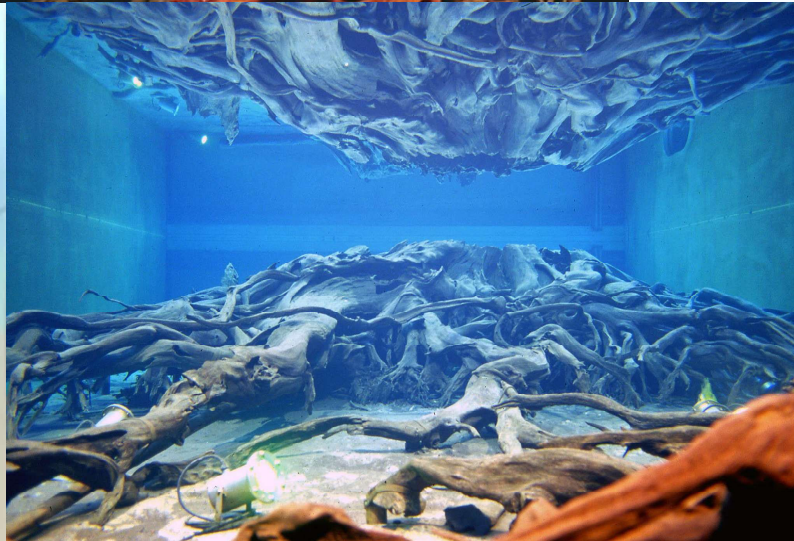
国特別天然記念物 魚津埋没林

＜魚津市埋没林博物館&地域のジオガイド＞ ふるさとへの関心・意欲を高める動画製作 …行けない所・昔の様子 見えない物を可視化する工夫