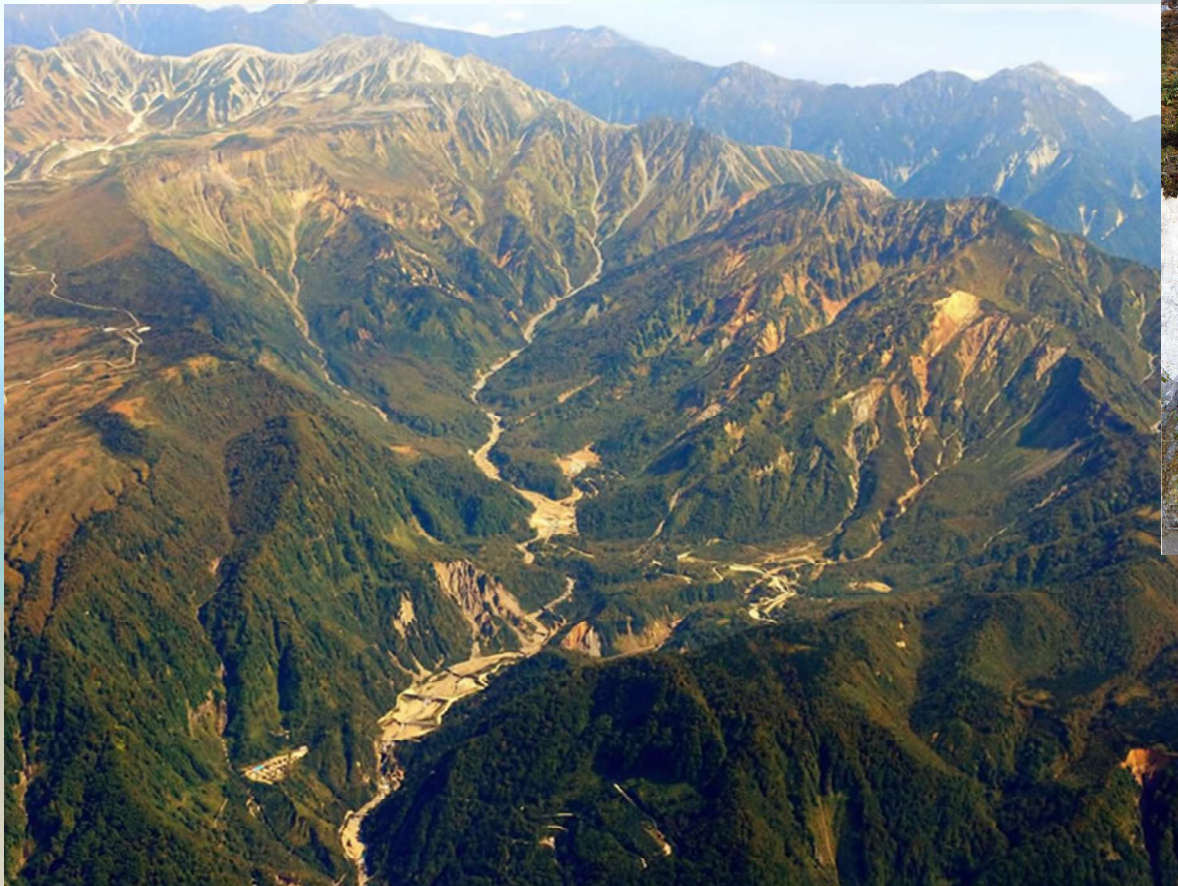
立山カルデラ（侵食カルデラ）