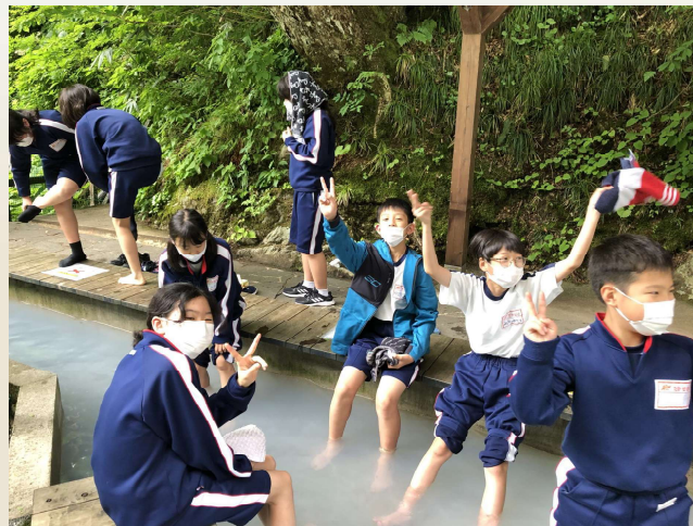
上流部祖母谷から引かれた 温泉のめぐみ