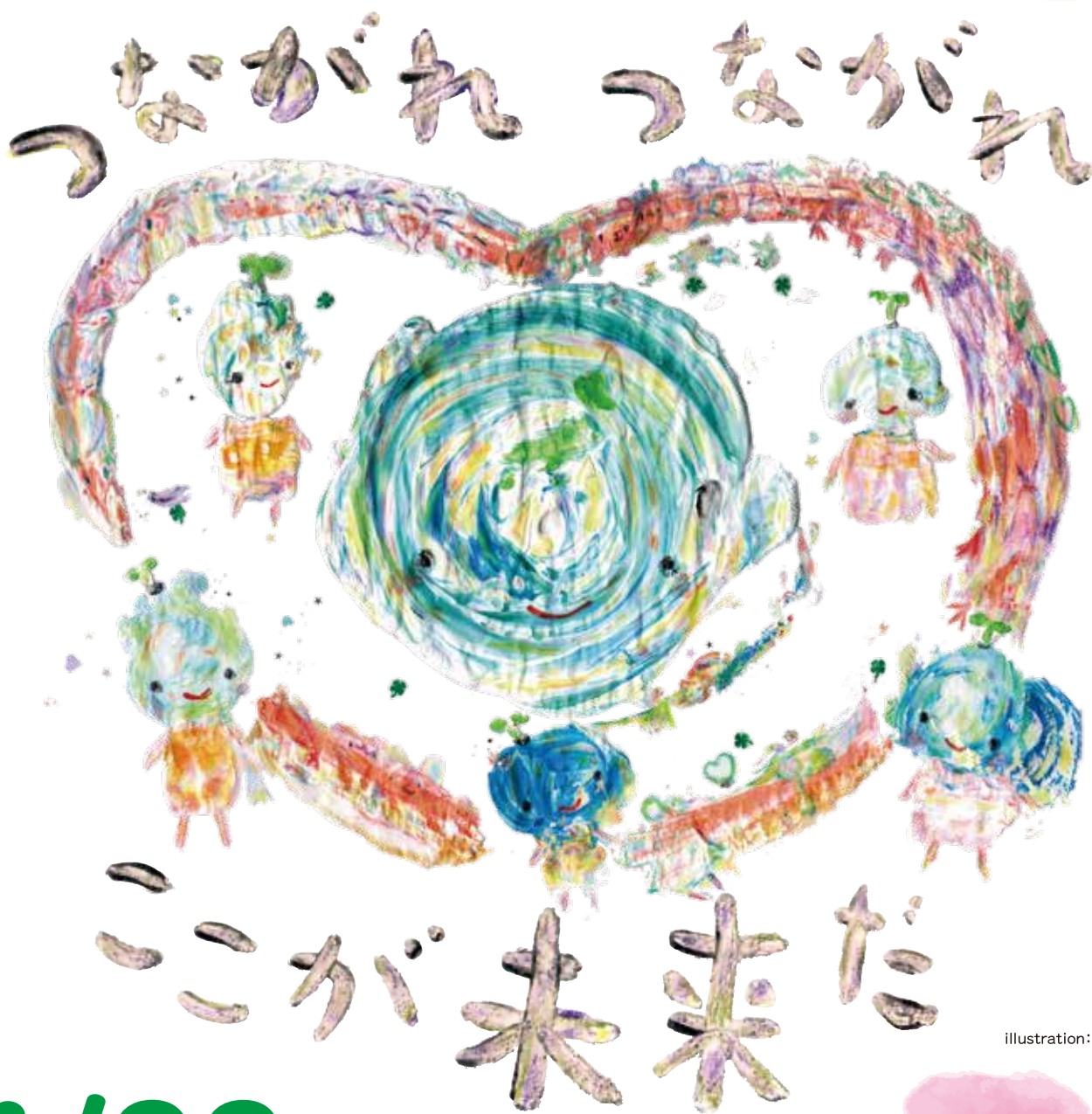
illustration: みやもと かえ